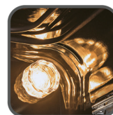
Halogenové osvětlení vnitřku trouby