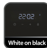
LCD displej White on Black